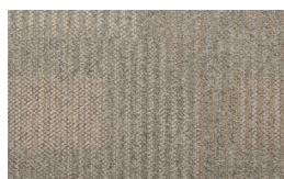
056 - Native