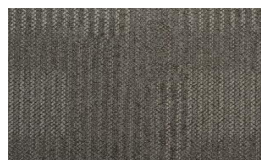
060 - Time