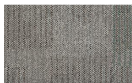
054 - Steel