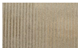
055 - Fancy