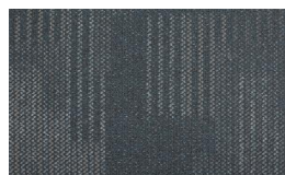
059 - Laguna