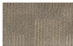
057 - Savana