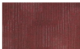
061 - Furnace