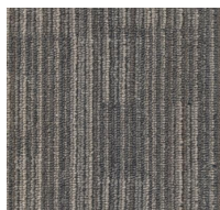
001 - Chip