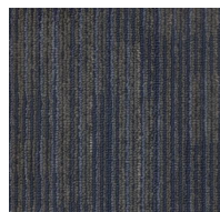
004 - Split