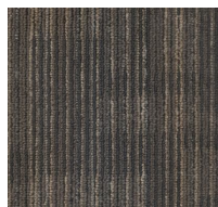
002 - Atom