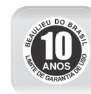
Selo de garantia de performance