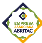
ABRITAC - Por ideias e ideais, na busca do desenvolvimento.